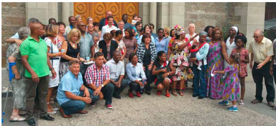
La dernière photo avant de quitter Aigle, en août 2017.