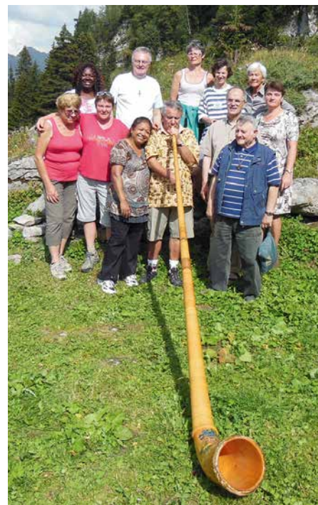
Sortie avec l'équipe pastorale, septembre 2016.

Il ne manquait pas une occasion pour égayer (et épater) ses amis et collaborateurs!