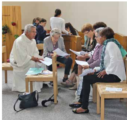
Pèlé de la Miséricorde, Saint-Maurice, juin 2016.

Charly était à l'écoute et savait écouter; un homme d'Eglise toujours positif, bienveillant, respecté et aimé de tous.