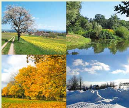
Les quatre saisons.

« Je suis le crayon que Dieu utilise. Le soir je viens me tailler dans la prière pour me ressourcer et repartir le lendemain. » Mère Teresa.