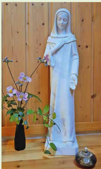
Vierge de l'offrande.

En retraite paroissiale à Ars, j'ai eu un coup de cœur pour cette statue de la Vierge Marie. J'ai été touchée par son expression pleine de douceur. Je l'ai accueillie chez moi ainsi elle m'invite à offrir chacune de mes journées et à y semer de la douceur.