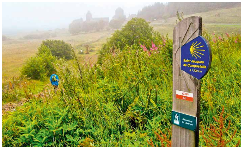
Sur le chemin de Compostelle.