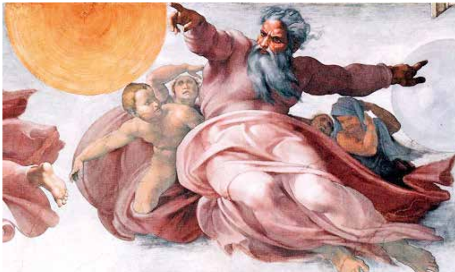
Dieu créateur selon Michel-Ange, chapelle Sixtine, Vatican.