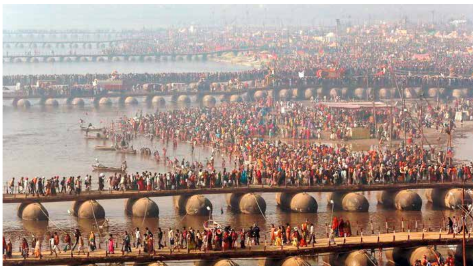
Pèlerins massés sur les rives du Gange.

cer à mourir pour vivre véritablement » ?